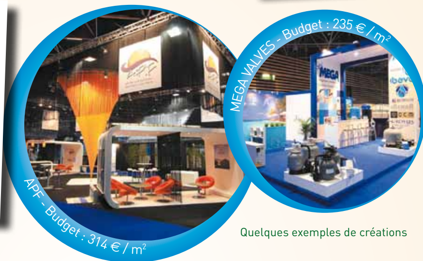
Quelques exemples de créations

Retrouvez plus d'exemples de conceptions sur www.wellgreen-expo.com , rubrique « Exposer », puis « Aménager votre stand ».